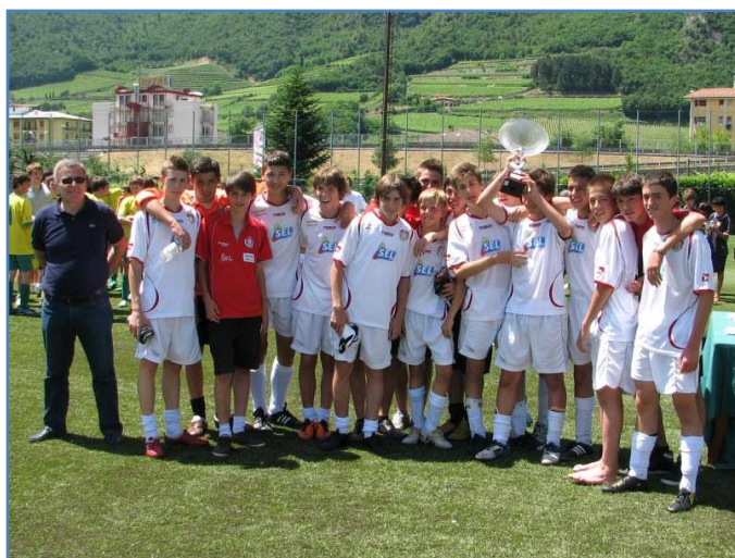
F.C. Sudtirool - 1 a squadra classificata edizione 2011